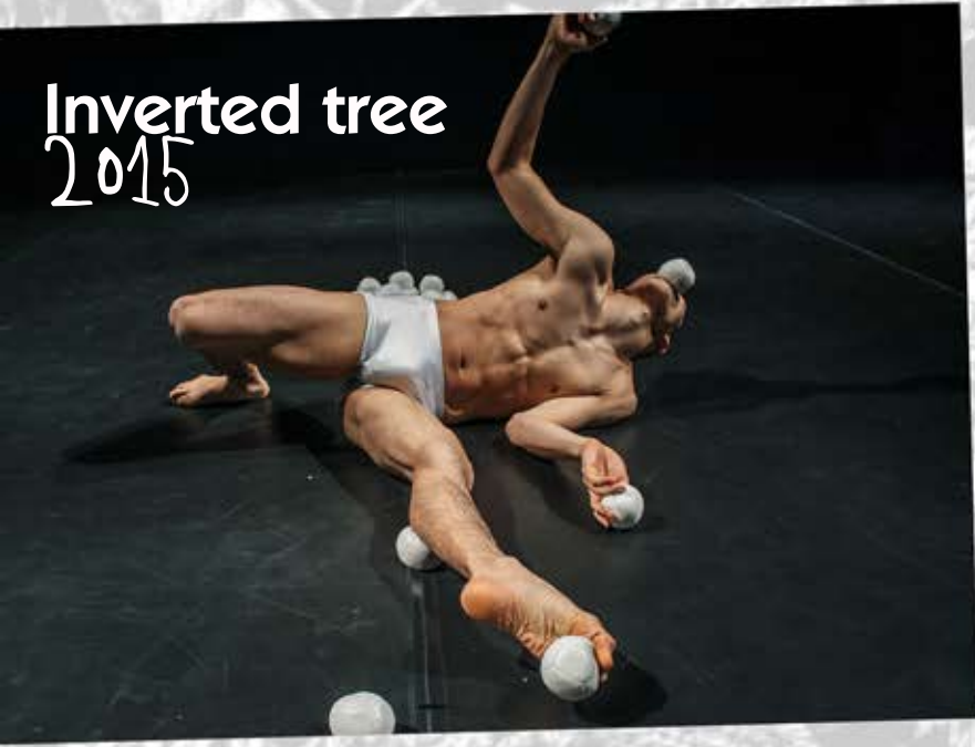
Inverted tree 2015

Fondée par Hisashi Watanabe en 2015 et basée à Kyoto, elle mène des projets pour creuser de nouveaux concepts du jonglage comme art au delà des genres. Toujours à propos d'une relation entre un "humain" et un "objet".